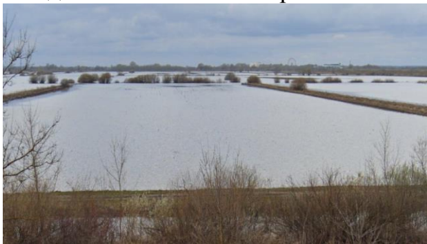
Рисунок 1 – Вид на экспериментальный участок зимой 2024 года Figure 1 – View of the experimental site in winter 2024

достаточно высокого снежного покрова, который составлял 55 см к концу зимы и недостаточным - во второй.