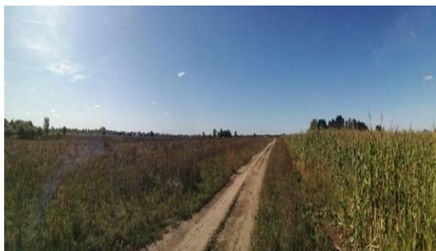
Рисунок 2 - Вид двух участков перед закладкой опыта: агрофитоценоз (справа) и залежь (слева)

Полевой опыт заложен на двух участках в четырехкратной повторности (рисунок 2). NI - агрофитоценоз, NII - залежь. Предшествующие культуры викоовсяная смесь и луговая злаково-травянистая растительность соответственно.